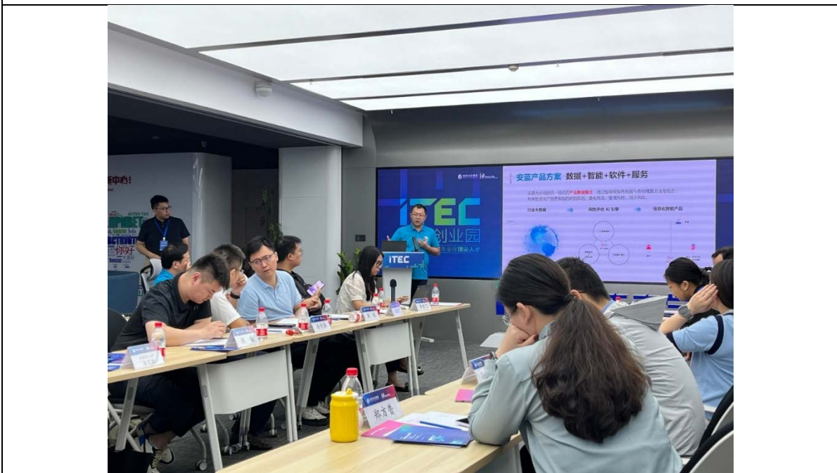
数码港初创代表与当地企业交流科技应用，探讨业务发展和合作机会。